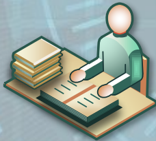
Rechtsamt, Datenschutz, RPA, Vergabestelle