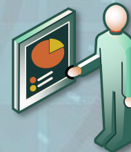
Presse- und Öffentlichkeits- arbeit