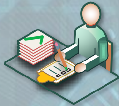
Referat für digitale Verwaltung und Organisations- entwicklung