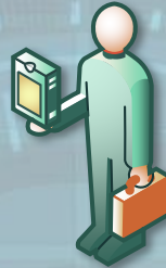
Initiative Smart Parking